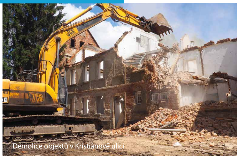
Demolice objektů v Kristiánově ulici