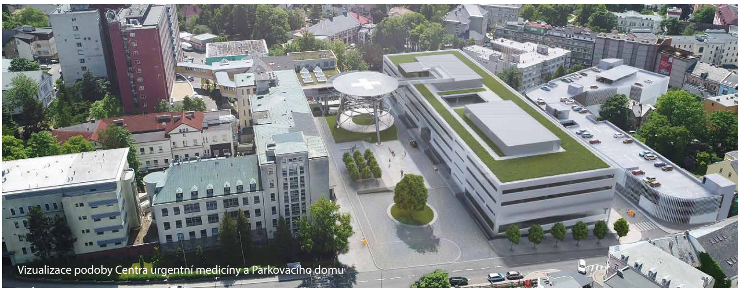
Vizualizace podoby Centra urgentní medicíny a Parkovacího domu