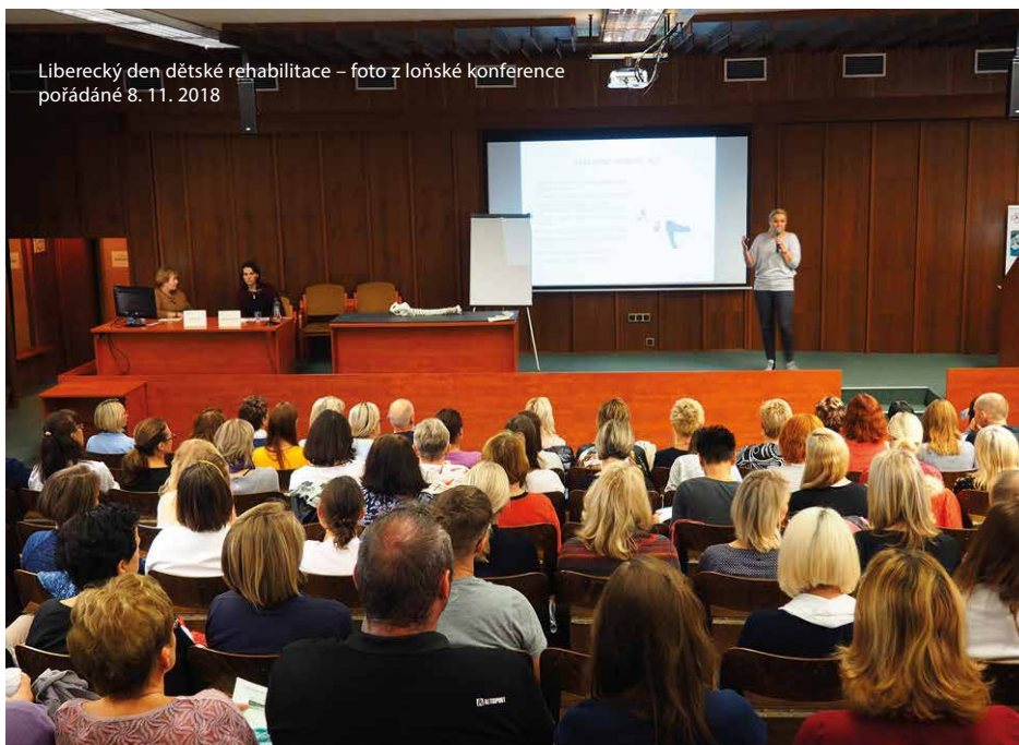
Liberecký den dětské rehabilitace – foto z loňské konference pořádáné 8. 11. 2018